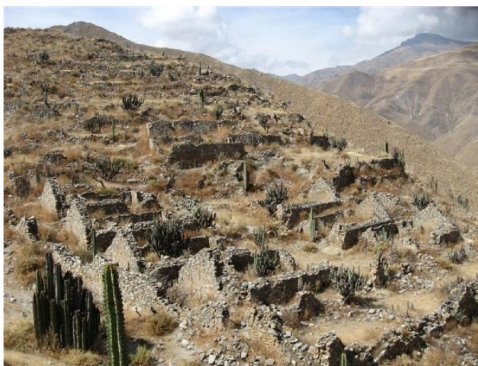
Sitio Arqueológico Pueblo Viejo de Omas

Los Coayllo eran naturales del valle de Asia y habitaban la chaupiyunga de la cuenca del río Asia u Omas. Cuando se creó la Villa de Cañete, una amplia zona en el contorno de lo que es hoy San Luis, estaba habitada por indígenas de Coayllo.