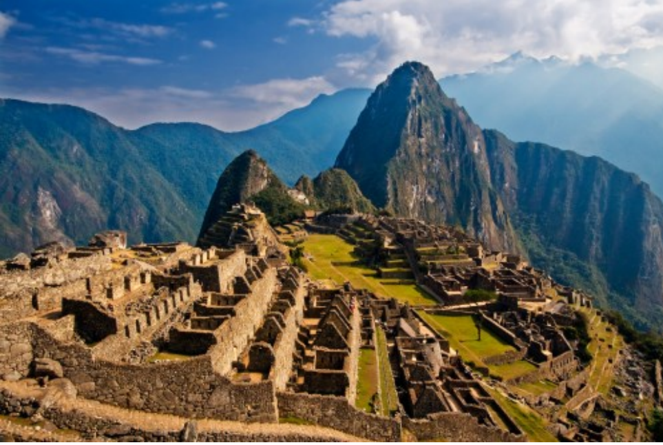
Early morning in wonderful Machu Picchu